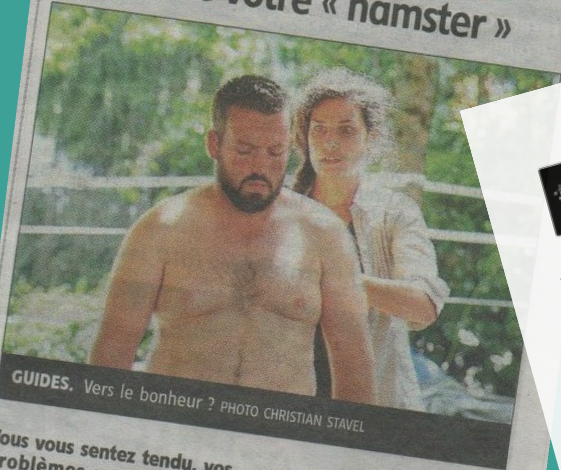
GUIDES. Vers le bonheur ?